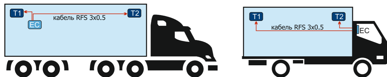
Схема размещения измерителя-регистратора и датчиков

T1, T2 - датчики температуры, EC - измеритель-регистратор EClork-M